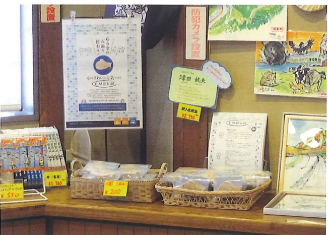
海鮮工房にて販売中!!

今年は500個の製造・販売を計画していましたが、予想を遙かに上回る売れ行きで、四月上旬には売切れ状態になってしまったため、追加で1000個のせっけんを製造するため、毎週作業に取り組んでいます。 EM菌せっけんは、そのまま排水に流すと環境汚染につながる食用廃油を材料に使用しており、尚且つ、EM菌には海を浄化する作用があるの