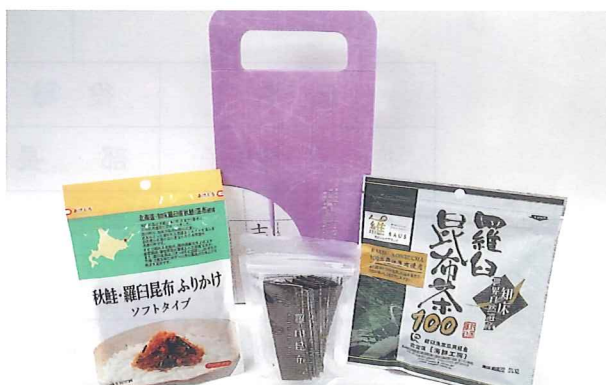
香典返し (R-21ふりかけ・おつまみ・昆布茶)