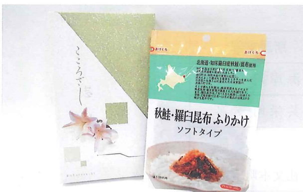
香典返し (R-1秋鮭・羅臼昆布ふりかけ)

※30セット以上ご購入の価格です。30セット未満やご用意しているセット以外についてはご相談ください。 (価格は要相談)